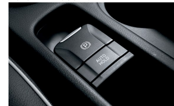
Elektronska parkirna kočnica