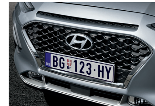
18" Alu naplatci (opciono) Aktivna vazдушna krilca / Vazдушna zavesa

Ekonomičnost u potrošnji goriva najbolja u klasi