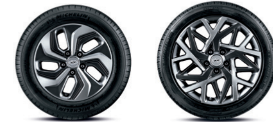
16" alu naplatci