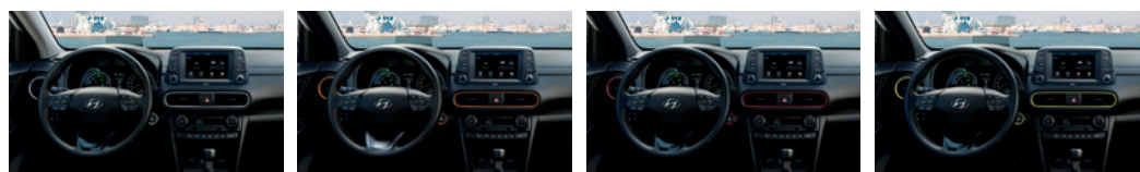
Crni Narandžasti Crveni Boje limete