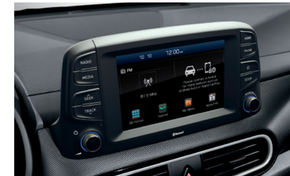
7" displej sa ekranom osetljivim na dodir (uključujući i unutrašnje pojačalo)