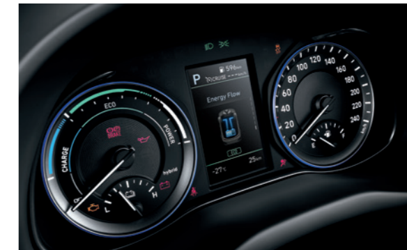
4.2" Supervision instrument tabla

Sedišta imaju štep u beloj kontrastnoj boji za još više stila. Kako biste dodatno prilagodili unutrašnjost, tu je i dodatna prednost da izaberete između tri druga opciona paketa boja: Narandžasti, Crveni i boje Limete. Takođe je dostupna i nova informaciona digitalna instrument tabla, koja se pogodno nalazi odmah pored brzinometra. 4.2" LCD ekran prikazuje važne informacije o vožnji poput protoka energije, kao i status aktivnih bezbednosnih funkcija, preostali raspon goriva i potrošnju goriva, navigacione instrukcije i spoljnu temperaturu. Hibridni merač prikazuje napunjenost baterije i status pražnjenja, kao i status punjenja baterije.